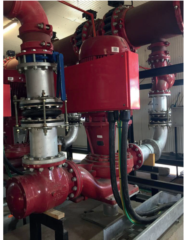
Instalación de la bomba de la serie e-80SCXL en un centro de datos en Dubai.

El sello de la bomba de la serie e-80SCXL incluye un diseño de cabezal unificado giratorio para su fácil reemplazo. Tiene un sistema impulsor de metal a metal positivo que reduce el esfuerzo de torsión sobre los fuelles. Además, los fuelles incluyen un soporte para presión sin pliegues ni dobleces para un menor esfuerzo y una mayor vida útil del sello. La bomba e-80SCXL incluye un sello mecánico estándar con enjuague interno con una presión máxima de funcionamiento de 16 bar. También hay disponibles dos sellos mecánicos opcionales, cada uno con una presión máxima de 25 bar. Uno está instalado internamente y el otro es para su instalación externa. Ambos tipos de sellos utilizan una línea de enjuague externa para extender su vida útil.