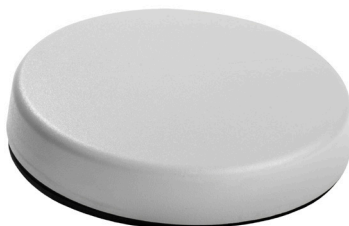
Antenne, stor, flad, vandal- sikker til Connect / Chatter