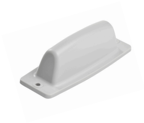
Antenne til væg, finne, til Connect / Chatter