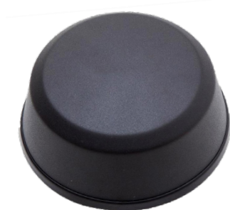
Antenne med ekstra for- stærkning, vandalsikker til Connect/Chatter