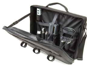
ソフトキャリングケース (内容物一部除く)