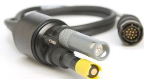
ケーブル/センサー

■センサー選択： 上部センサー：pHまたはORPセンサー 下部センサー：ポーラロDOまたはガルバニDOセンサー