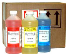
pH 標準液 3種

■センサー選択： 上部センサー：pHまたはORPセンサー 下部センサー：ポーラロDOまたはガルバニDOセンサー