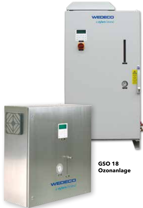
GSO 18 Ozonanlage