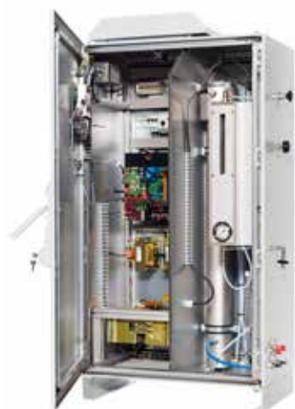
Innenansicht: GSO 18 Ozonanlage