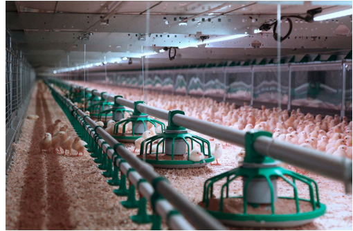
De luchtwassers worden gebruikt om de lucht te reinigen in veeteelt-toepassingen.

De overstap naar één type pomp helpt het bedrijf tot slot ook bij het verwezenlijken van verdere ontwikkelingen. "Veel boerderijen richten zich in het kader van klimaatverandering ook op het besparen van energie. Hiervoor hebben wij nu een klimaatsysteem ontwikkeld dat kan worden gekoppeld aan de wasser. De belangrijkste functie is het - via een warmtewisselaar - terugwinnen van de warmte die in de afgezogen lucht uit de stallen zit. Deze warmte wordt weer teruggebracht in de stal waardoor de veehouder aanzienlijk kan besparen op zijn verwarmingskosten."