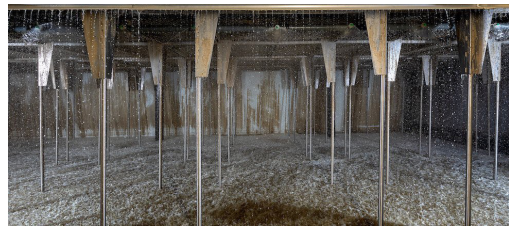
Fijnstof slaat door de waterdruppels neer. De gereinigde lucht kan geloosd worden en het restproduct kan als meststof over het land uitgereden worden.